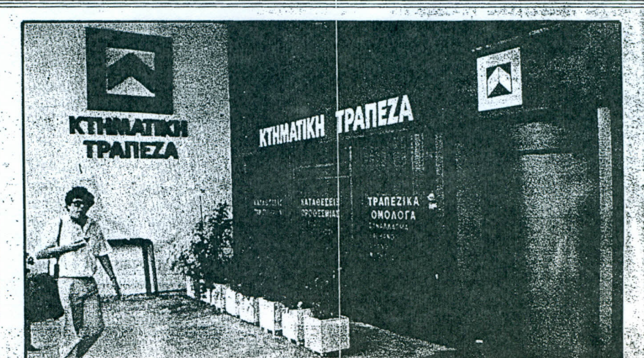
Το κεντρικό κατάστημα της Κτηματικής στην Αθήνα. Δέχτηκε την «επίθεση» καταθετών για αναλήψεις ή πληροφορίες.

Μετά το τέλος της ακρόασης και απαντώντας σε ερωτήσεις δημοσιογράφων, η