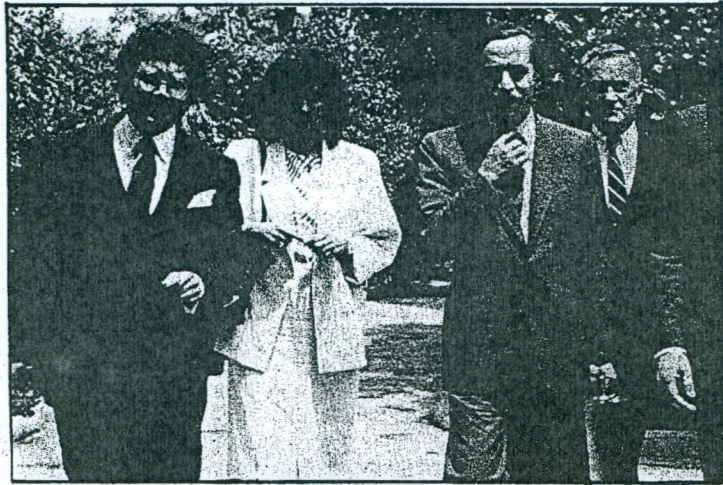
Ο υφυπουργός Εμπορίου της κυβέρνησης Ρήγκαν, Γκόλντφιντ, κατά την επίσκεψή του στην Ελλάδα τον Μάη του 1986. Είχε προειδοποιήσει από τότε την Κυβέρνηση. Στη φωτογραφία, ενώ προσέρχεται στο Κασρί με τους Β. Παπανδρέου, Γ. Κασιφάρα, Γ. Παπαντωνίου.

Οι Αμερικανοί είχαν ενημερώσει τον Ανδρέα από το 1986