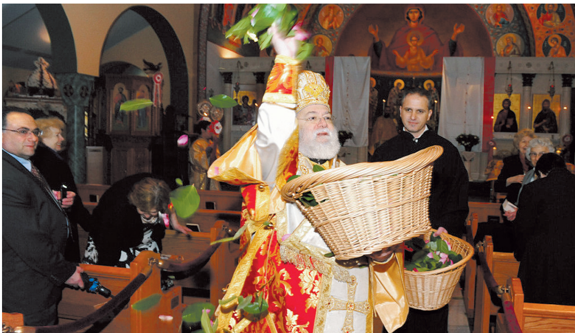
Την Κυριακή του Πάσχα στον εσπερινό της αγάπης και πάλι οι ναοί κατακλύζονται από κόσμο. Στο στιγμιότυπο ο επίσκοπος Σάββας της Ιεράς Αρχιεπισκοπής Αμερικής