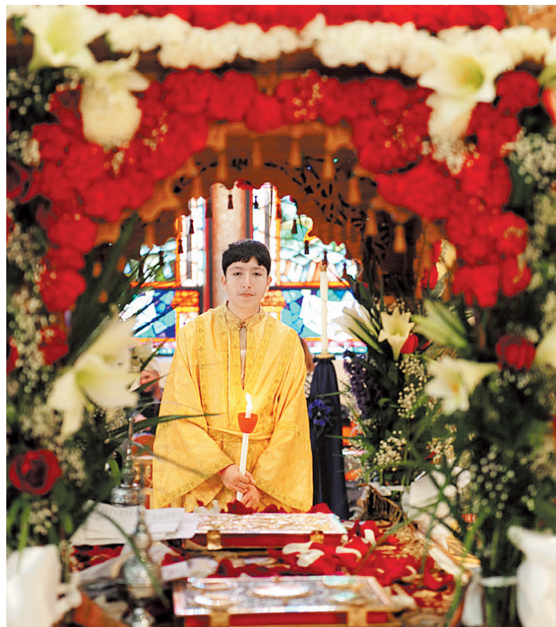
Τη Μεγάλη Παρασκευή σε πολλές περιοχές και ειδικά στο κέντρο της ελληνικής Αστόριας ούτε ένας, ούτε δυο, αλλά τέσσερις επιτάφιοι κάνουν περιφορά από τέσσερις διαφορετικές κοινότητες